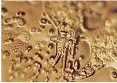
Du machst mich krank