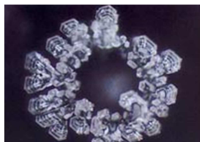
Wasser der Quelle von Lourdes

Auch die Theorie, dass Pflanzen ein Bewusstsein haben, bestärkte Dr. Masaru Emoto zu weiteren Experimenten. So behaupten Theorien, dass sich im Pflanzenwachstum große Unterschiede feststellen lassen, wenn sie netten oder bösen Worten ausgesetzt sind. Das Wasser, das also z.B. in Pflanzen enthalten ist, so Emotos Vermutung, muss also den Worten zuhören.