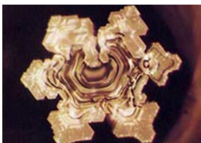
Mozarts Sinfonie Nr. 40

Eine seiner wichtigsten Erkenntnisse in diesen ganzen Jahren war die, dass der Zustand des Wassers nicht fix ist sondern beeinflussbar. Und zwar ganz klar, eindeutig und jederzeit reproduzierbar reagiert die Struktur des Wassers auf Schwingung, Musik, Gedankenkraft und Worte.